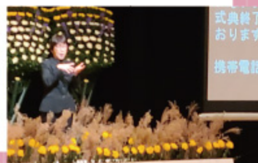
式典終了 おひらき 携帯電話

中途失聴者を中心に、難聴者等の多様なニーズに対応する要約筆記に必要な知識及び技術を習得している者。厚生労働省令に基づく認定資格。