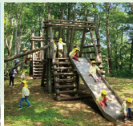
市街地の子どもも大喜びの園児の自然体験(大岡)