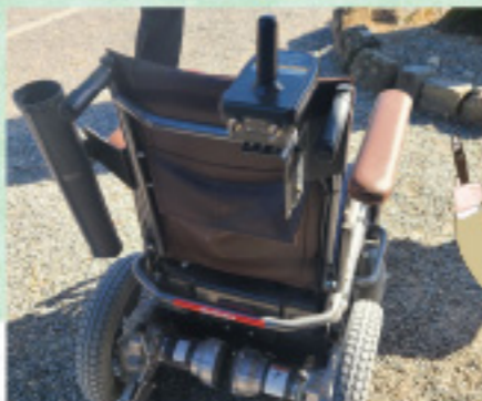
砂利道OKの電動車いす(三重県・伊勢神宮)