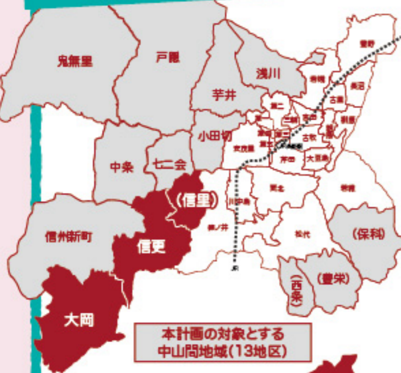
本計画の対象とする中山間地域(13地区)

長野市の魅力は、なんと言っても街と豊かな自然が近いこと。清らかな空気と水、田園や山の風景、伝統的な文化、おいしい農産物。長野市の魅力の多くをうみだしている中山間地域にあらためて注目です！