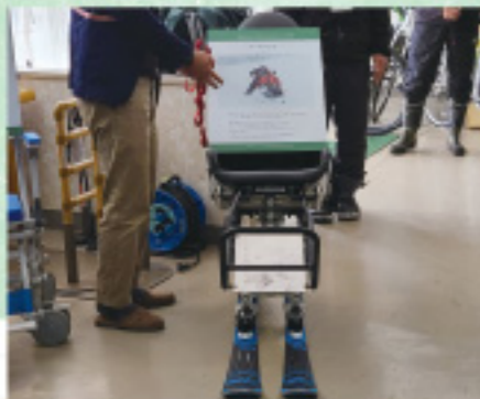
デュアルスキー(戸隠観光協会)

*ユニバーサルツーリズム:年齢や障害等にかかわらず、誰もが気兼ねなく参加し、楽しめる旅行