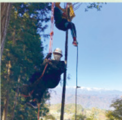
親子森林体験(大岡)私もロープで木登り